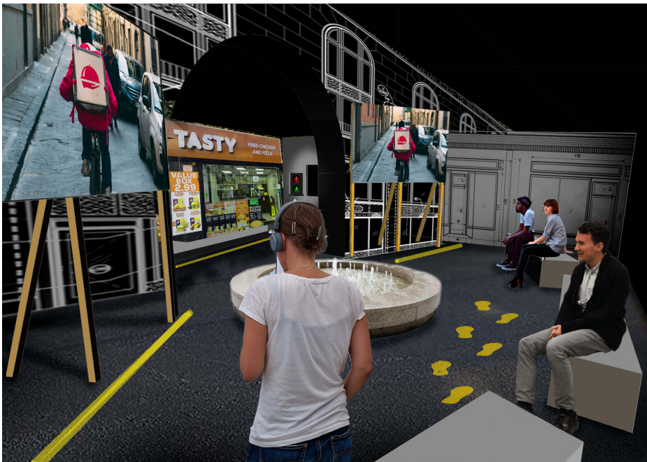
Recreació de l'escenografia d' Urban Nature

Urban Nature és una proposta del col·lectiu Rimini Protokoll (Helgard Haug, Stefan Kaegi i Daniel Wetzel). Van ser alumnes avantatjats de l' Institut d'Arts Escèniques Aplicades de Giessen , durant molt temps considerat la bèstia negra del teatre alemany. Concentració d'artistes heterodoxos, inconformistes, activistes de la dissidència, políticament compromesos, contraris al potent establishment de les grans institucions teatrals del país i la seva constel·lació de directors estrella i autoritats úniques i consagrades.