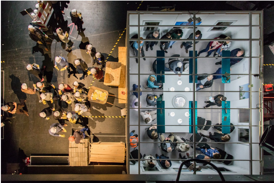
Society Under Construction